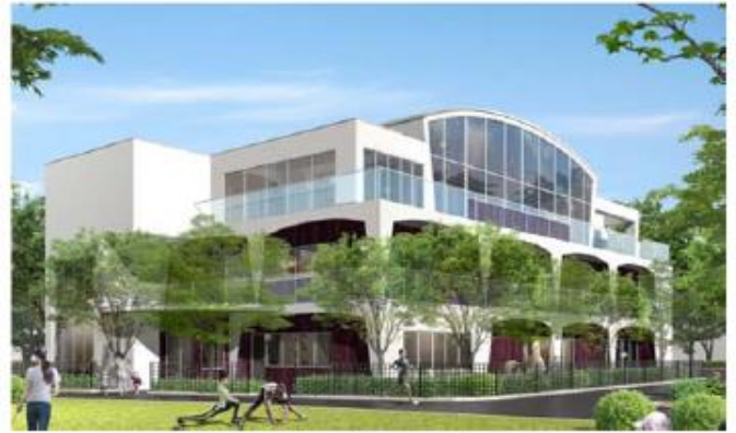
都立木場公園内保育所 完成イメージ

所在地等 木場4・5丁目（木場公園 大横橋口北側） 運営事業者 社会福祉法人 みわの会 定員総数 130人（予定） 開設時期 平成 30 年 4 月（予定）