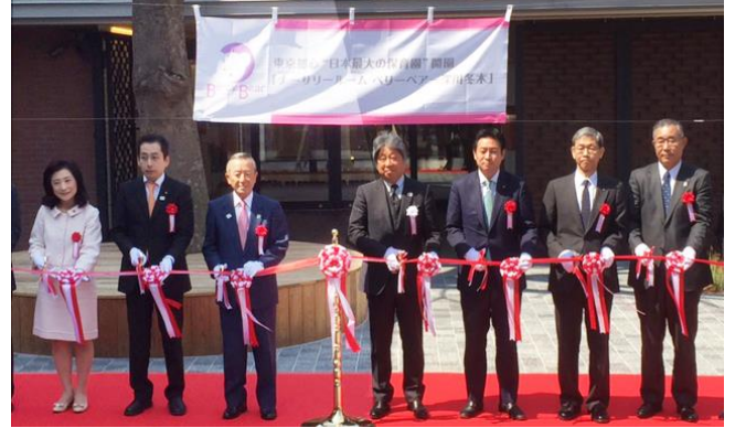
平成 29 年 3 月 28 日 国内最大級保育園 開園記念式典 ナーサリールーム ベリーベアー深川冬木

いずれにしても、仕事と子育ての両立しやすい環境づくりに向けて、国や都へも要望していきたいと思